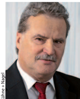
Kühne + Nagel